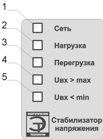
Рис.1 Лицевая панель стабилизатора.

На боковой панели корпуса стабилизатора расположены две розетки с заземляющим контактом (8) для подключения нагрузки и клеммные колодки (9) для подключения стабилизатора к сети и нагрузке.