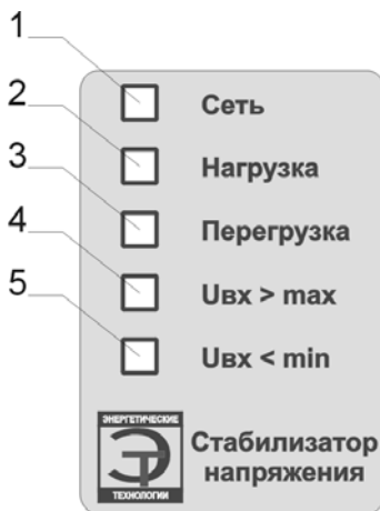
Рис.1 Лицевая панель стабилизатора.

заземляющим контактом для подключения нагрузки мощностью до 2 кВА и клеммная колодка для подключения стабилизатора к сети и нагрузке.